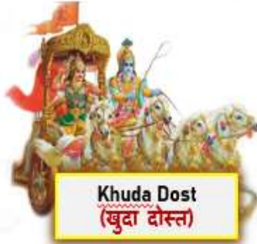
Khuda Dost (खुदा दोस्त)